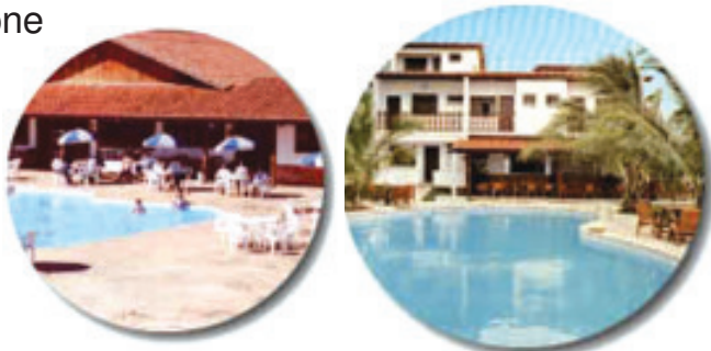
As fotos acima são das colônias do Pargos Clube: www.pargos.com.br

Ubatuba, Fortaleza, Atibaia, Rio das Ostras, Cabro Frio. Estâncias hidrominerais no sul de Minas, Pousada Recanto da Mata - em Baependi (estrada de São Tomé das Letras), pertinho de Caxambu e São Lourenço.