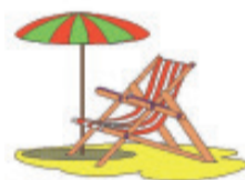
TABELA DE PREÇOS DA COLÔNIA DE FÉRIAS

Agora parceria também com a pousada do Sindicato dos Trabalhadores Têxteis, em Caraguatatuba. O sócio do Sindminérios paga R$ 10,00 a diária para a família. A reserva deve ser feita no Sindicato dos Têxteis, das 8h às 12h e das 14h às 17h, com 15 dias de antecedência. O site do Sindicato dos Textêis é o www.sindicatostexteis.com.br . É necessário apresentar a carteirinha de sócio do Sindminérios para efetuar a reserva.