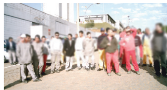
Acima, trabalhadores aprovam em assembléia pauta de reivindicações da data-base para negociação