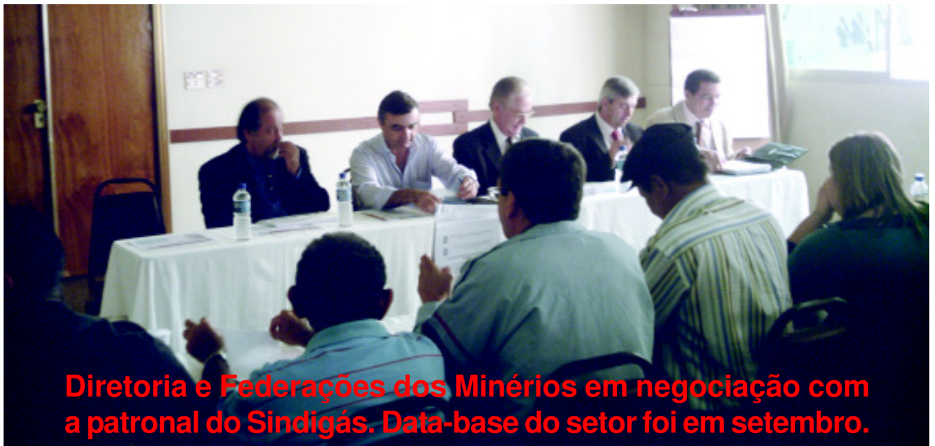
Diretoria e Federações dos Minérios em negociação com a patronal do Sindigás. Data-base do setor foi em setembro.

Os ataques ao Povo boliviano patrocinados pelo embaixador americano, já expulso do país acusado de conspiração, utilizando a ressentida elite da Bolívia, reflete na classe trabalhadora do Brasil, que sente na pele a falta do GNV. Tudo isso porque Evo Morales tem administrado o país com um olhar voltado mais ao povo boliviano, desagradando assim os barões do poder econômico.